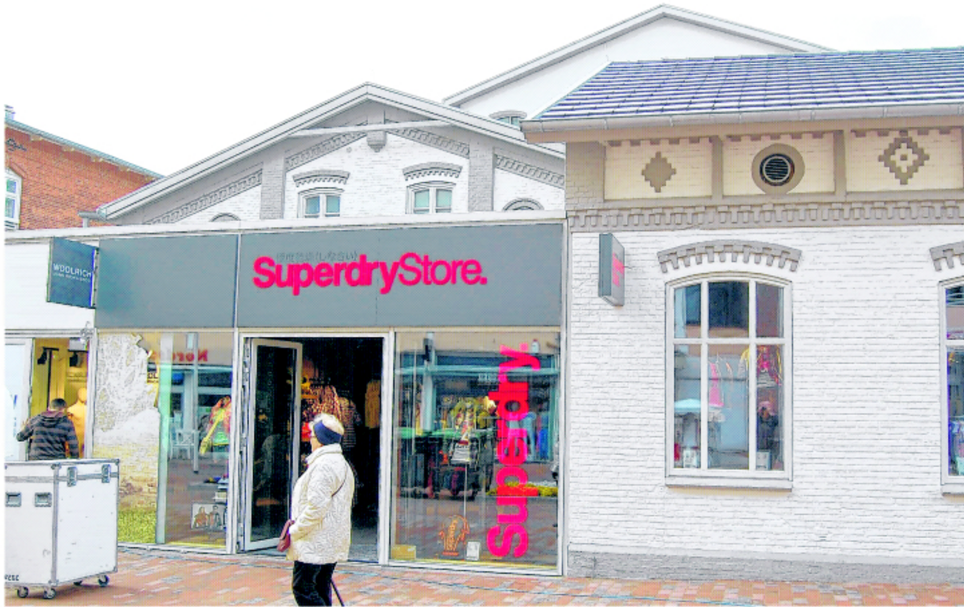
Ein frisches Weiß prägt jetzt die Optik des modernisierten Bäderstil-Gebäudes.