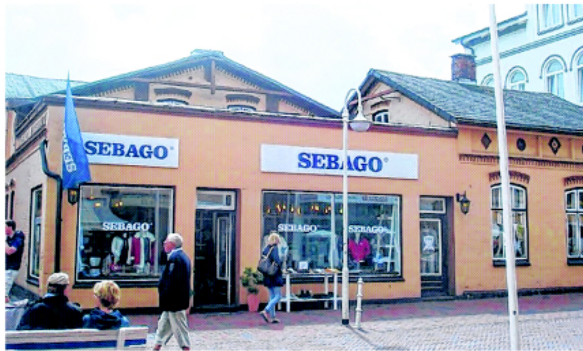
Der sanierungsbedürftige Altbau mit ockerfarbener Fassade.